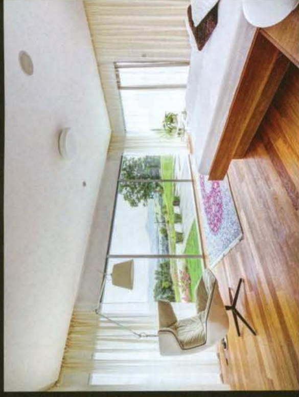
Ložnici rodičů obklopují ze tří stran pevně zasklené stěny. Velkoformátové prosklení s minimálním členěním, se subtilními hliníkovými rámy přispívá k pocitu splynutí s krajinou