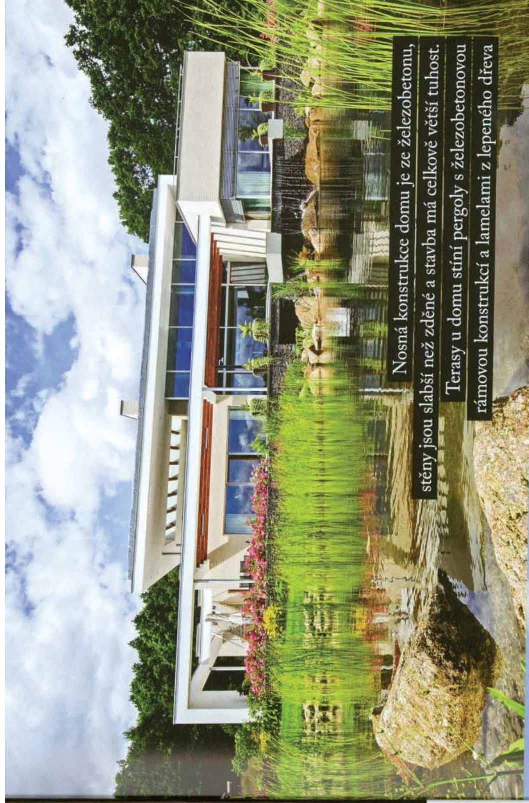
Nosná konstrukce domu je ze železobetonu, stěny jsou slabší než zděné a stavba má celkově větší tuhost. Terasy u domu stíní pergoly s železobetonovou rámovou konstrukcí a lamelami z lepeného dřeva