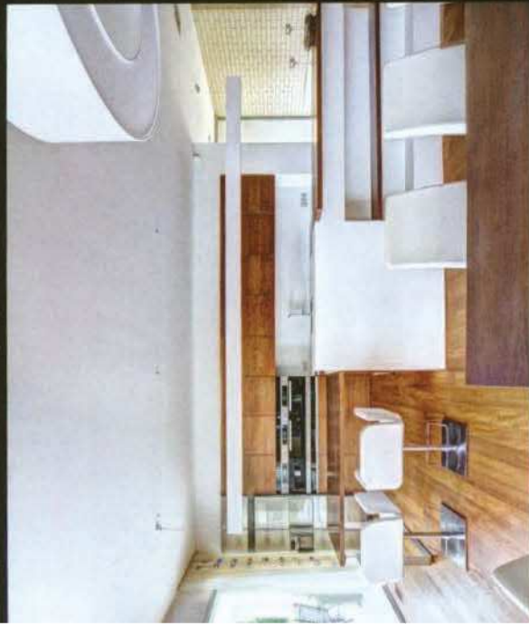
Celému přízemí udává tón krásná dvojvrstvá teaková podlaha. Teaková dyha byla použita i na zakázkově vyrobený nábytek včetně kuchyňské linky, dveří a vybavení koupelny